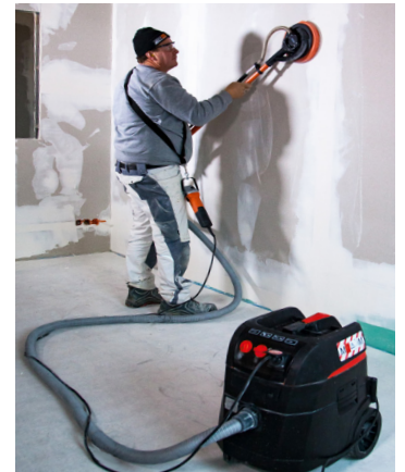
Kombinierbar mit allen ROKAMAT Schleifmaschinen