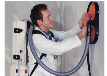
Rucksacksauger kombiniert mit CHAMELEON